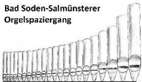
Bad Soden-Salmünsterer Orgelspaziergang